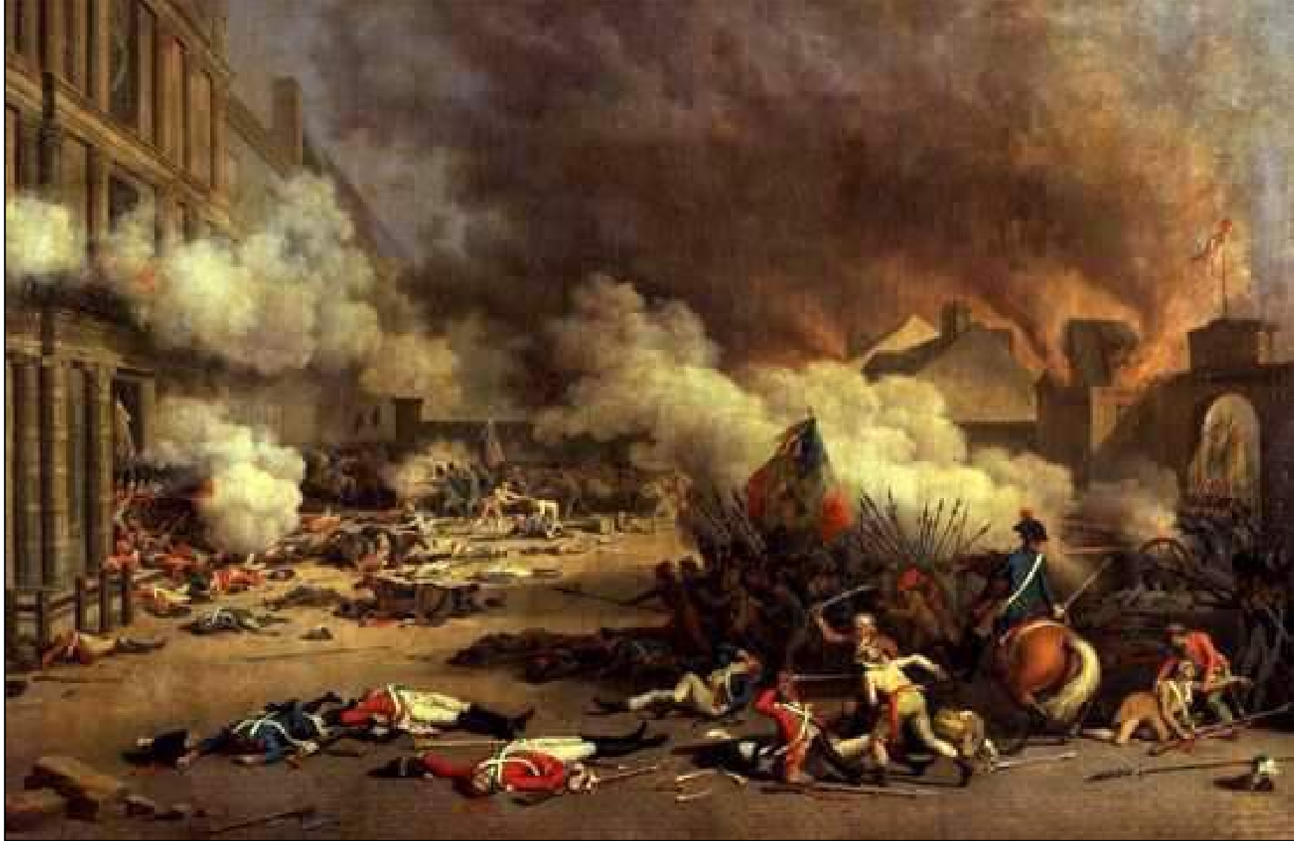
Document 4 : Prise du Palais des Tuileries le 10 août 1792 - J Bertaux - 1793