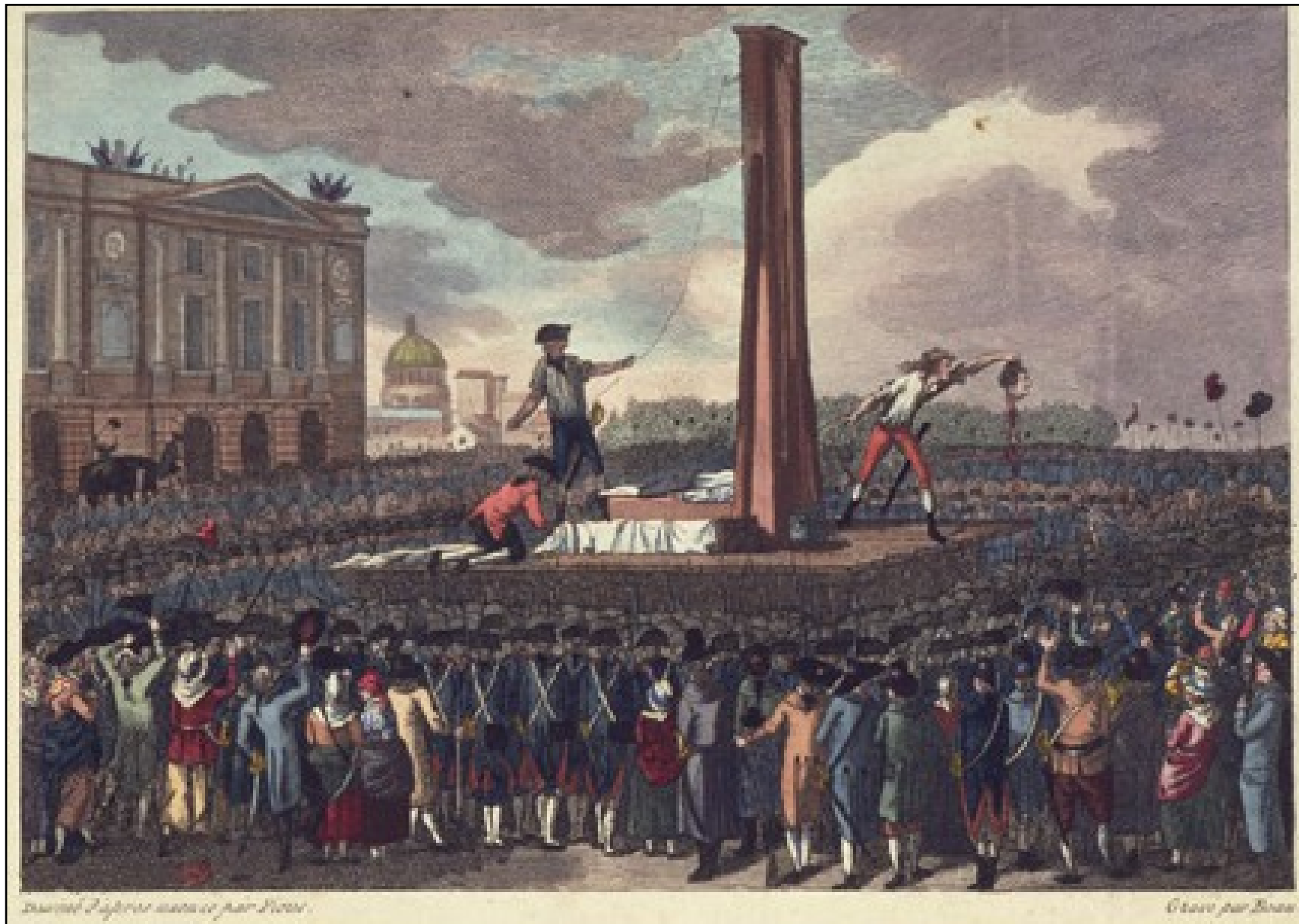
Document 5 : Exécution de Louis XVI - 21 janvier 1793 - musée Carnavalet