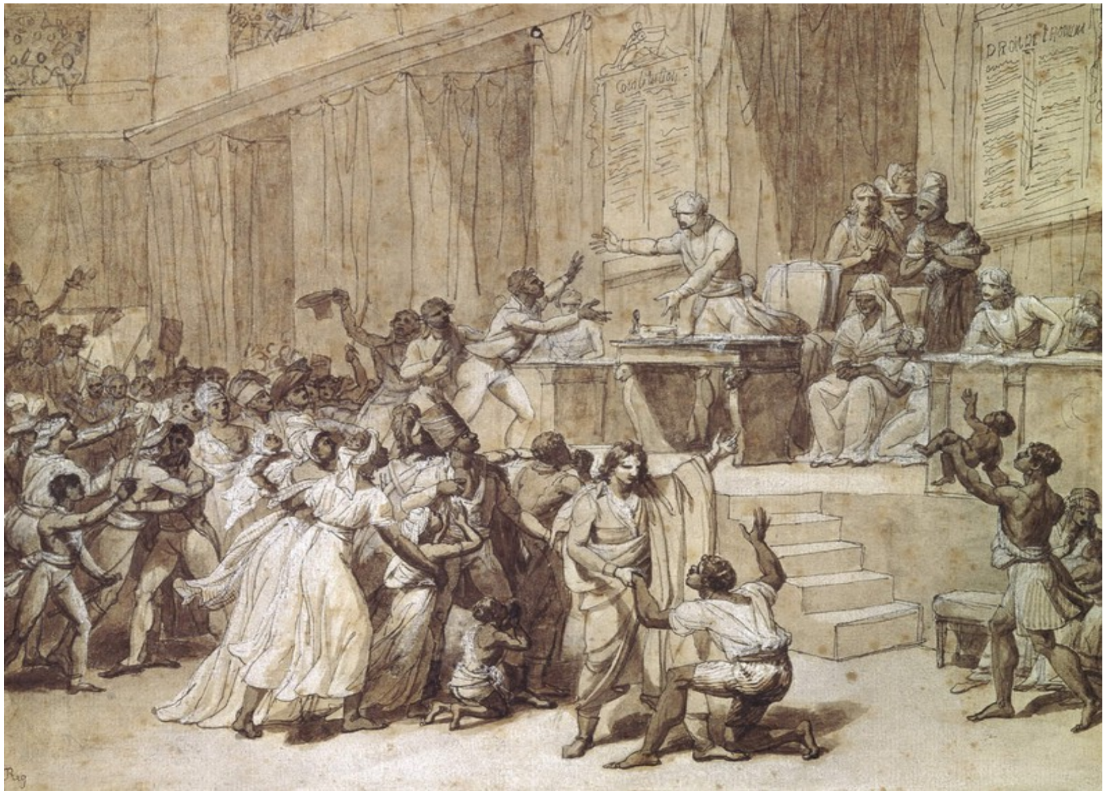
Document 10 : L'abolition de l'esclavage par la Convention, le 4 février 1794 - N.A. Monsiau - Grand Palais