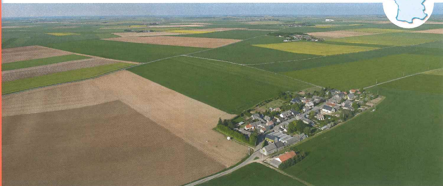
Doc. 1 Village de Boisville-la-Saint-Père dans l'Eure-et-Loir (Centre-Val-de-Loire)