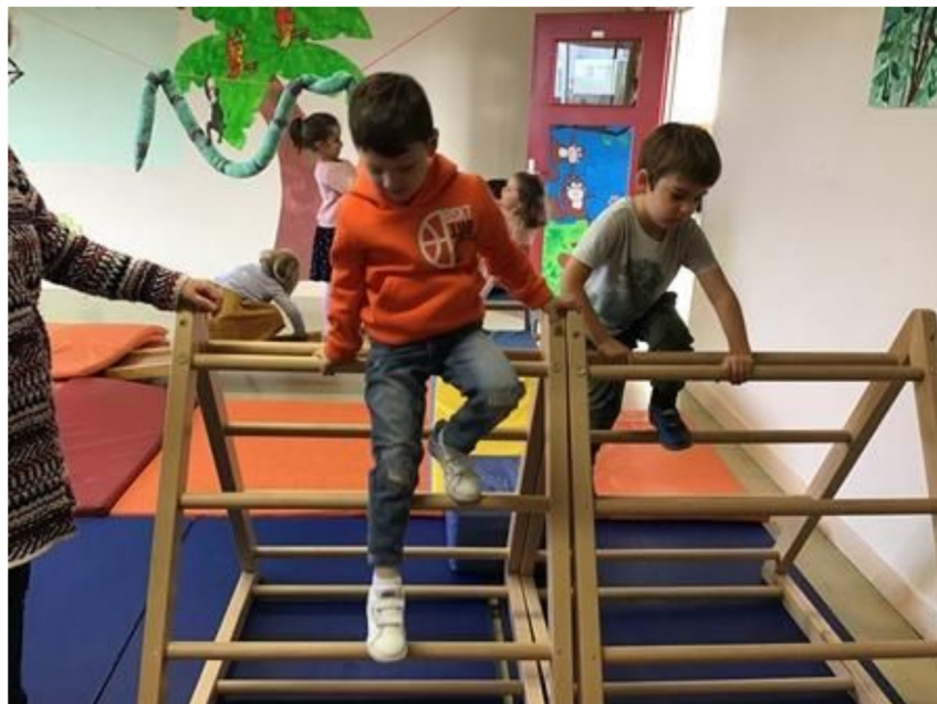
Jeux de récréation: